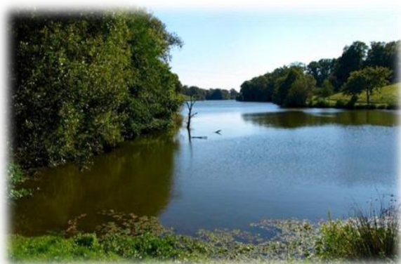
Le Val Saint Martin