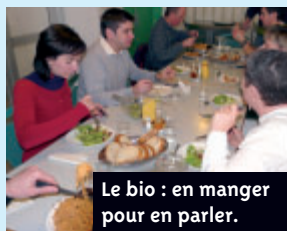
Le bio : en manger pour en parler.

Parmi les rendez-vous de la 2 e semaine du développement durable de Bouaye, la Ville propose aux habitants un repas-débat autour du bio le vendredi 15