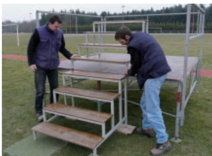
Le service « sports et manifestations » met en place le matériel nécessaire au bon déroulement des manifestations associatives.

Le service communication de la ville informe les Boscéens sur les différentes manifestations qui rythment la vie locale. Le calendrier annuel des manifestations recense toutes les dates importantes de l'année. Le magazine municipal, Bouaye Ensemble , annonce chaque mois les événements à venir et fait connaître les activités, les projets, les succès, les initiatives culturelles, les exploits sportifs... De plus, le site Internet présente toutes les associations, classées par thème, dans un annuaire régulièrement mis à jour. Enfin, le panneau d'information lumineux, installé Place des Echoppes, permet à chaque association qui en fait la demande, d'annoncer ses manifestations.