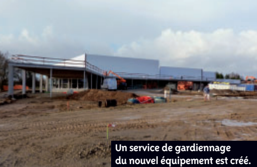
Un service de gardiennage du nouvel équipement est créé.