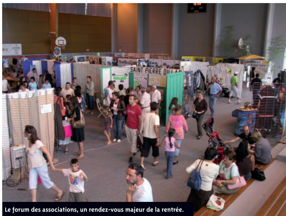
Le forum des associations, un rendez-vous majeur de la rentrée.

Organisé chaque année, le forum des association draine des centaines de visiteurs de Bouaye et des environs, à la recherche d'un sport, d'un loisir à pratiquer ou tout simplement curieux de connaître les activités existant à Bouaye. Le succès de la 20 e édition de ce rendez-vous a démontré une fois de plus, la vitalité des acteurs et l'utilité pour les associations et les clubs de promouvoir leurs activités, tout en favorisant de nouvelles adhésions ●