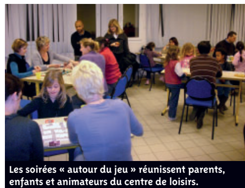
Les soirées « autour du jeu » réunissent parents, enfants et animateurs du centre de loisirs.

Des « goûters philo » sont organisés pour les enfants au café librairie L'Equipage, un mercredi tous les deux mois. Ces ateliers sont encadrés par des professionnels