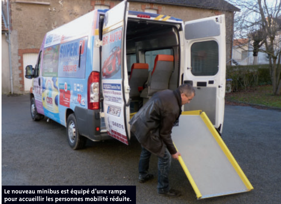
Le nouveau minibus est équipé d'une rampe pour accueillir les personnes mobilité réduite.

Un nouveau minibus, financé par quinze partenaires économiques locaux, est dés-