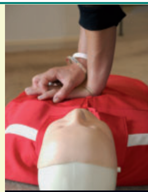
Une formation pour connaître les gestes qui sauvent.

Les bénévoles du Centre de Soins Infirmiers de Bouaye-Les Sorinières, associés aux autres Centres de Soins du Pays de Retz et à la Mutualité Sociale Agricole, organise cinq formations aux gestes de premiers secours. L'une d'entre-elles se déroule à Bouaye, le samedi 2 avril, de 8h à 17h, et dimanche 3 avril, de 8h à 12h (une participation de 30 € est demandée). Cette formation de 12 heures, agréée par le Ministère de l'Intérieur, aborde l'usage du défibrillateur. Renseignements et inscriptions au 02 40 32 61 62.