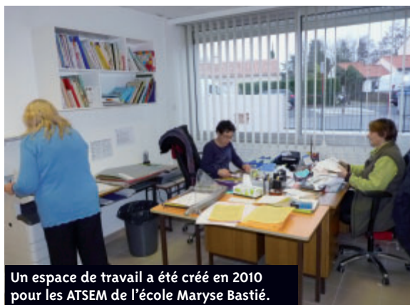
Un espace de travail a été créé en 2010 pour les ATSEM de l'école Maryse Bastié.

midi, elle accompagne les enfants avant, pendant et après le repas. Elle surveille et assure l'encadrement sur la cour et met en place des activités adaptées au temps de midi. Puis, viennent les temps de la sieste et du goûter pendant lesquels les enfants sont accompagnés. Présentes tout au long de la journée, les ATSEM contribuent, aux côtés des enseignants de maternelle, à la qualité reconnue de la première scolarisation des jeunes enfants ●