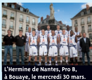
L'Hermine de Nantes, Pro B, à Bouaye, le mercredi 30 mars.

Les Gars d'Herbauges, la Ville de Bouaye et le Conseil général de Loire-Atlantique se mobilisent le mercredi 30 mars, à 14h, pour accueillir l'Hermine Nantes Atlantique, à l'ensemble sportif des Ormeaux. Les jeunes supporters, licenciés des clubs locaux, mais aussi les adhérents de l'animation sportive départementale, sont invités à assister à l'entraînement décentralisé du club professionnel de basket nantais qui évolue en pro B (animation avec les jeunes, dédicaces...) ●