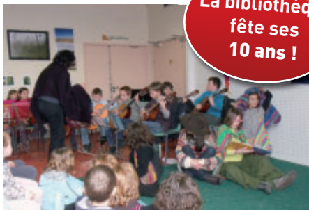
Une lecture en musique par les jeunes lecteurs sera proposée pour les 10 ans de la bibliothèque.

Déjà dix années que la bibliothèque est installée dans ses locaux actuels, place du Marché. Dix ans de promotion de la lecture publique. Dix ans d'animations autour du livre, de l'écriture. Dix ans de rencontres, de dédicaces, de spectacles... avec un public toujours plus nombreux. Pour démarrer les réjouissances, des ateliers seront proposés aux 9-12 ans pour apprendre à lire des histoires à voix haute. Ils se dérouleront le mercredi 9, le jeudi 10 et le vendredi 11 mars, de 14h à 17h, à la bibliothèque . Le résultat de ce travail s'achèvera le mercredi 23 mars, sur un spectacle déambulatoire et musical interprété par les